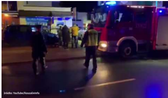
Tragedia w Koszalinie - pięć faktów