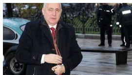
Brudziński o próbie odebrania dziennikarzom nagrania: wyjaśnię tę...