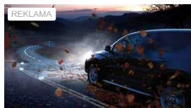
Bezpieczna droga? A może żarówki Toyota?