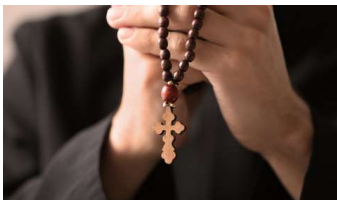
Opublikowano aktualizację "Mapy kościelnej pedofilii w Polsce"