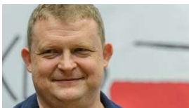
Kolejna odsłona konfliktu Macierewicz-Piątek